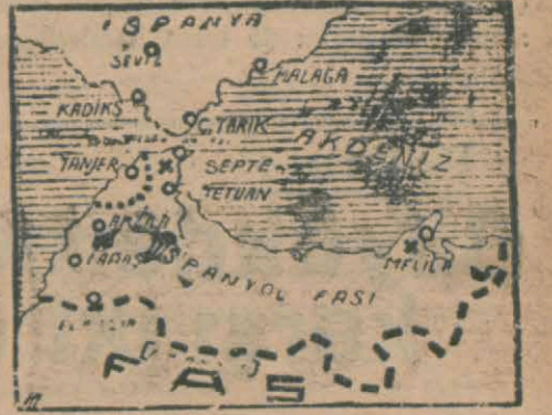
Bütün dünyanın gözlerini çevirdiği İspanyol Fasının bir haritası

Filvaki İspanyol sularındaki Alman kruvazörleri yeni senenin ilk günlerinde fevkalâde faaliyet gös-