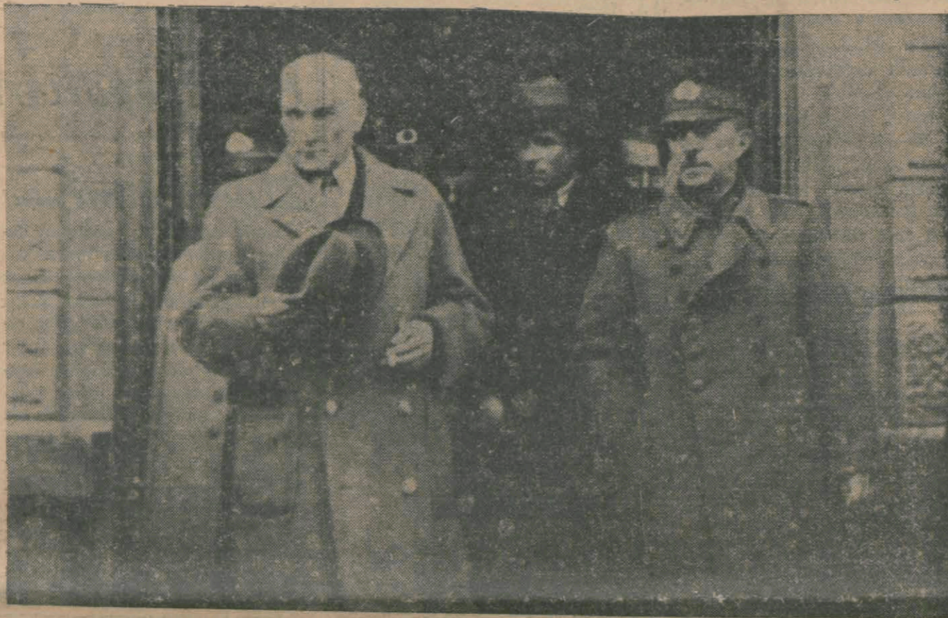
Atatürk Konyada İken ordu müfettişi Orgeneral İzzettinle birlikte istasyondan çıkarılarken...

Gülünç bir haber daha: Küçücük Beylân kasabasında üç bin Arap talebe var mı?