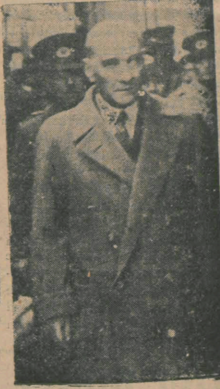
Atatürk Konya istasyonunda!

Araplar ve Ermeniler statükonun muhafazasını istemekte ve Türkler ise ikiye ayrılmaktadırlar. (Devamı 6 ncı sayfada)